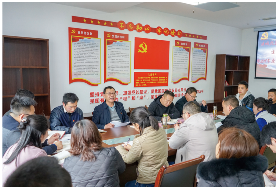
机关党支部组织生活会。

本报讯 3月中旬，一场场辣味十足、红脸出汗的组织生活会相继在区域投集团党委所属党组织中召开。