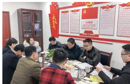
永光党支部组织生活会。