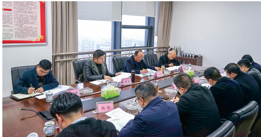
集团党委班子成员认真开展批评和自我批评。

本报讯 按照上级部署和要求，3月6日，区域投集团党委班子召开2018年度民主生活会，以习近平新时代中国特色社会主义思想为指导，以强化创新理论武装，树牢“四个意识”，坚定“四个自信”，坚决做到“两个维护”，勇于担当作为，以求真务实作风坚决把党中央决策部署落到实处为主题，紧密联系集团党委班子和