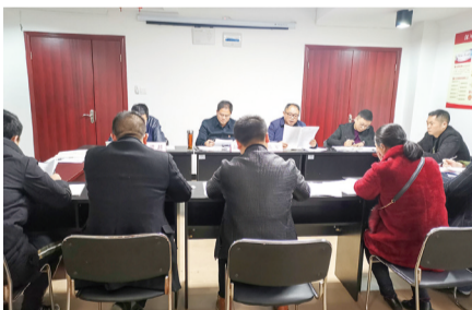
坤唯党支部组织生活会。