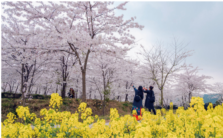
木凉樱花醉游人。

说好不写有关春天的文字的，因为古往今来关于春天的文字浩如烟海，总怕一不留神，就步人后尘，落得个东施效颦的名声，让自己“不抄袭、不盲从”的写作戒律毁于一旦。可是，面对铺天盖地的鲜花和满眼旖旎的春色，我有些把持不住一不去搜肠刮肚的堆砌溢美之词，表达一下对春天的感触总可以吧。有了一点牵强的理由，我就迫不及待的敲上了键盘。