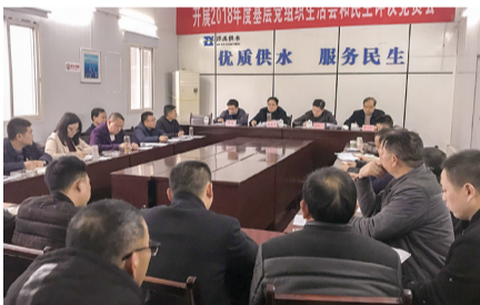
泽禹党支部组织生活会。