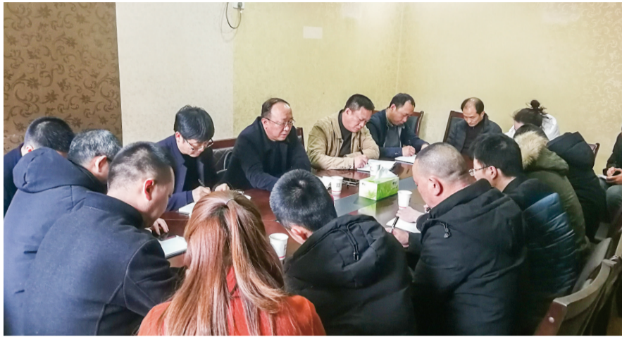
区域投集团召开“东街故城项目建设办公室”第一次工作会议。