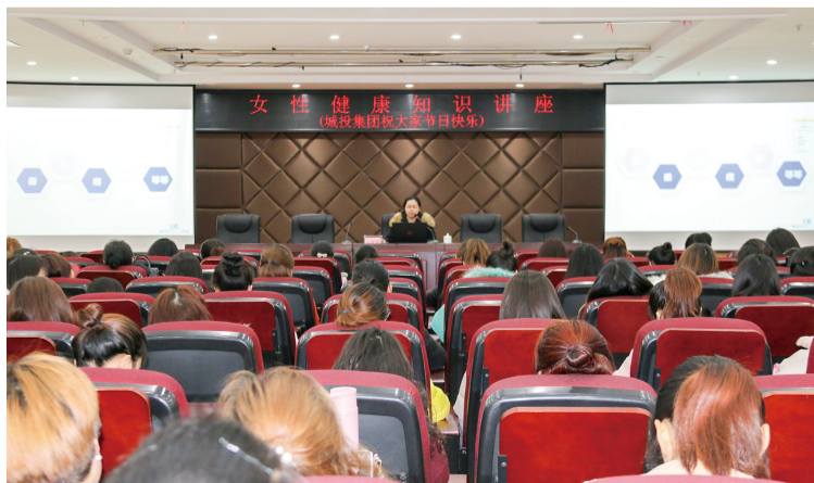
区域投集团开展健康知识讲座。