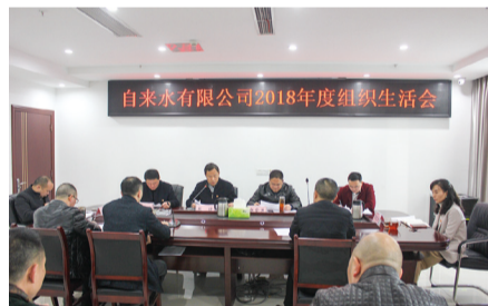
自来水公司组织生活会。