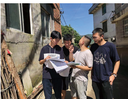
现场复核房屋面积。