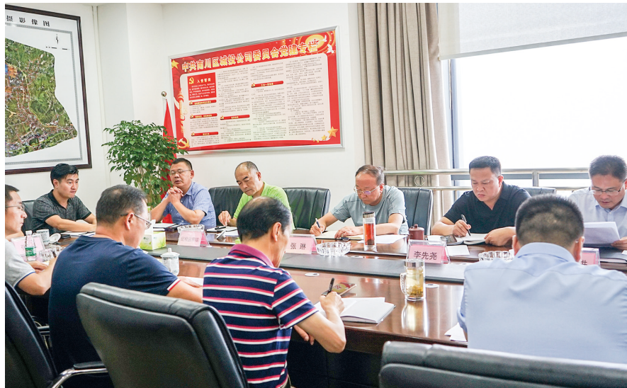
区城投集团党委召开7月党委理论学习中心组(扩大)学习会。