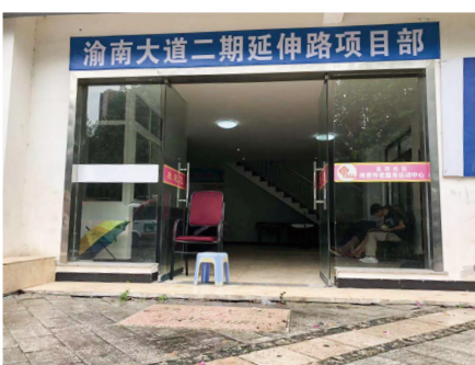
渝南大道二期延伸路项目部。