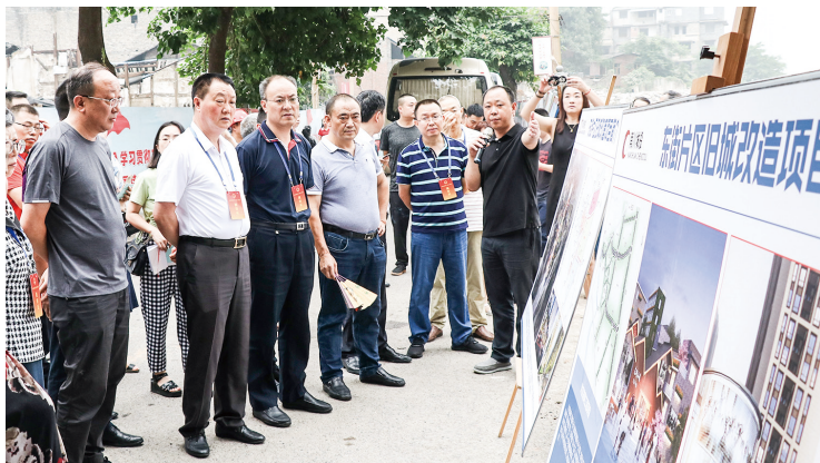
区人大常委会视察东街片区旧城改造项目。